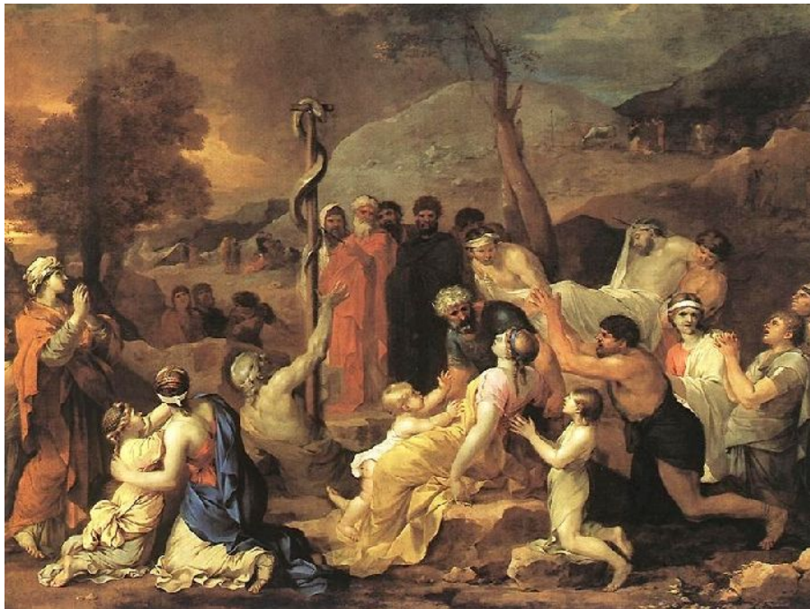
"Mojsije i bronzana zmiya" (Sebastien Bourdon – 1653.)

Kada je Mojsije pobjegao u pustinju, naišao je na starog i mudrog učitelja. Jotor je bio africki - Etiopski - vrhovni sveštenik, čuvar zbirke kamenih tablica. Kada se Mojsije oženio njegovom kćeri, Jotor ga je učinio posvećenikom visokog nivoa. Na to se aludira u priči o plamenom grmu. Kada je Mojsije video grm kako gori a ne izgara, to je bila vizija ličnosti koja nije uništena pročišćujućim ognjem koji čeka s druge strane groba. Iz vizije plamenog grma je proisteklo Mojsijevo osećanje misije, potreba da radi za dobro čovečanstva, da nas sve povede u zemlju u kojoj teku med i mleko. Baš tada, dok je Mojsije oklevao pred veličinom tog zadatka, Bog mu pomaže da se odluči: „Taj štap uzmi u svoju ruku, njime ćeš činiti čudes!“ Tako se Mojsije uputio nazad u Egipat, nameran da od faraona zatraži slobodu za svoj narod.