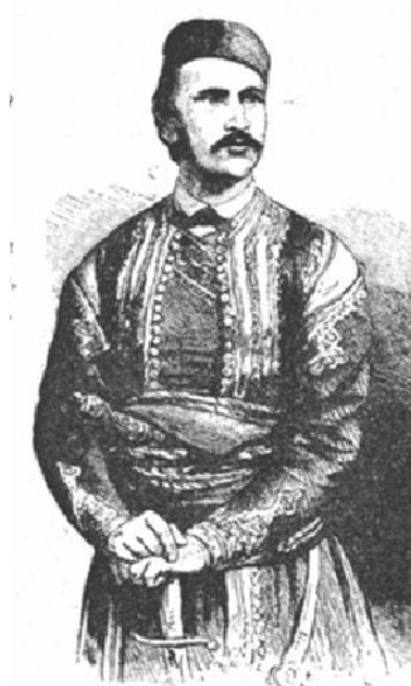
Mićo Ljubibratić, vojvoda iz Hercegovačkog ustanka

Drugi učesnik i jedan od vođa hercegovačkog ustanka „Nevesinjska puška“, koji se našao u Beogradu 1876. godine bio je vojvoda Mićo Ljubibratić, rodom iz Ljubova kod Trebinja. Prema navodima masona Srete Stojkovića 1 on je verovatno ušao u masonski savez kada i Zega, u dodiru sa italijanskim garibaldincima koji su bili dobrovoljci i u srpskom ustanku u Hercegovini, 1852 – 1862. godine, a koji je predvodio vojvoda Luka Vukalović.