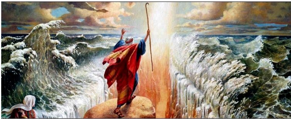
Mojsije vodi svoj narod

Dostojan protivnik za Mojsija, pomislili bi smo. No, pojavio se jedan problem. Arheolozi su otkrili da, ako tražite Jevreja u vreme vladavine Ramzesa II, ili ako tražite, npr. tragove pada Jerihona ili Solomonovog hrama u odgovarajućim arheološkim slojevima, nećete naći apsolutno ništa. To je dovelo do zaključka naučnike da su epski mitovi o poreklu Jevreja „samo mitovi“, tj. da nemaju osnovu u istorijskoj stvarnosti. Ovde vredi napraviti kratku pauzu kako bi smo se upitali: koliko su ti ljudi želeli da te priče budu netačne, koliko je na njihove stavove uticalo adolescentsko veseije reskrinkavanja bajki iz detinjstva?