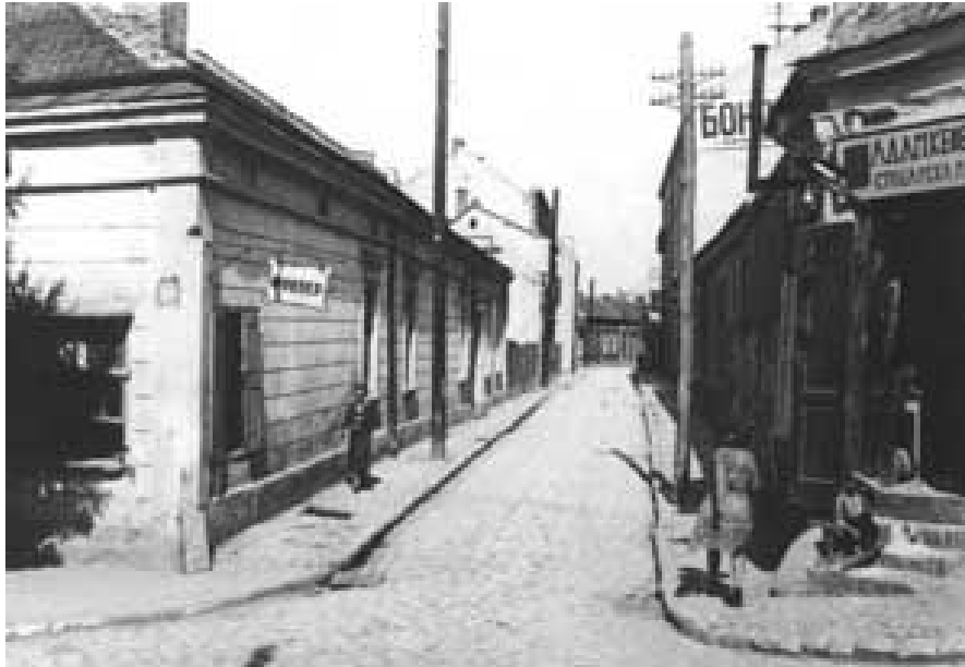
Zgrada (prva sa leve strane) na uglu Knez Miletine i Zetske ulice u Beogradu, u kojoj je od 1876. do 1881. godine radila loža "Svetlost Balkana"

Prostorije lože su se prvobitno nalazile u hotelu „Srpska Kruna“, ali se ubrzo, već u decembru 1876, loža preselila u zgradu na uglu i Zetske i Knez Miletine ulice u Beogradu.