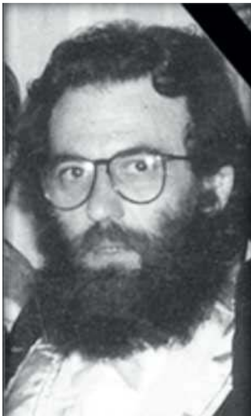
Slika 1 - Zoran Nenezić iz mlađih dana

Zoran Nenezić je rođen u Beogradu 16. Decembra 1952. godine, a preminuo je 25. Marta 2021. Završio je Filološki fakultet Univerziteta u Beogradu, smer za srpskohrvatski jezik i jugoslovensku književnost. Tokom svog profesionalnog života je radio kao pravobranilac samoupravljanja, analitičar, književnik, publicista, istoriograf i novinar. Pisao je poeziju i prozu i objavljivao novinske tekstove kako u zemlji tako i u inostranstvu. Radio je kao novinar „Duge“, a njegove intervjuue su objavljivali gotovo svi vodeći dnevni i nedeljni listovi.