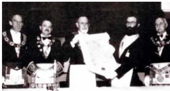
Slika 3: Predaja Povelje o reaktiviranju VL “Jugoslavija”

inicijativi, ali i zbog straha tamošnjih članova od moguće državne represije.)”