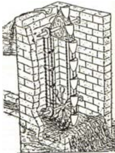
Uređaj za podizanje vode pokretan vodenim tokom, Filon Vizantijski 3 v. p.n.e.

Pumpe za podizanje vode na veće visine i potom za navodnjavanje koristile su se u Egiptu. Po dostupnim literaturnim podacima za njihov pogon korišćene su vodna kola, a mnogo kasnije vodenična kola. Vodenična kola i prve vodne turbine na reakcijskom principu pronalazi Ktesibijev učenik, Heron Aleksandrijski.