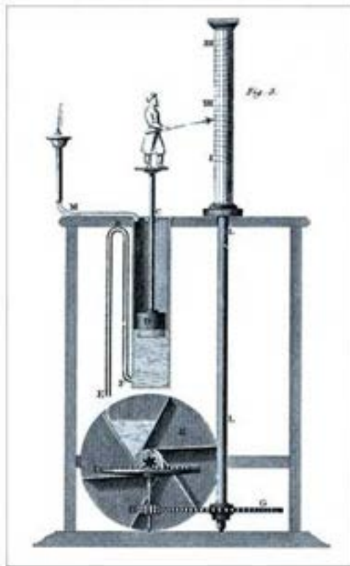
Prikaz vodenog sata kojeg je napravio Ktesibije Aleksandrijski u 3. veku pne.

Ktesibijevi rukopisi nestali su u požaru čuvene Aleksandrijske biblioteke , no zahvaljujući istoričarima tog doba, Filonu , Vitruviju i Heronu , dostupni su opisi njegovih izuma . Nalazimo tako opise pumpi, hidrauličkih orgulja, katapulta na komprimovani vazduh, vodenog sata, te preteče dvostepenih vatrogasnih pumpi.