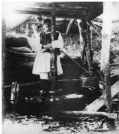
Vodenica u Srbiji iz 19-og veka.

Postoji zapis iz 1205 godine na arapskom jeziku u kom su opisane vodenice na reci Tigru. Ovo kolo je stiglo i preko Severne Afrike i Španije, a preneli su ga Mavri. Razlika između vodnih i vodeničnih kola je što je u ovim drugim voda dovođena zatvorenim cevima, a zatim za to vreme veliki pritisak je u malznici prevođen u veliku brzinu strujanja. Tako jr omogućeno da se ista snaga postiže sa znatno manjim dimenzijama, jer je i brzina obrtanja bila značajno veća. Stepem korisnosti im je dupliran, sa 20% na 40%.