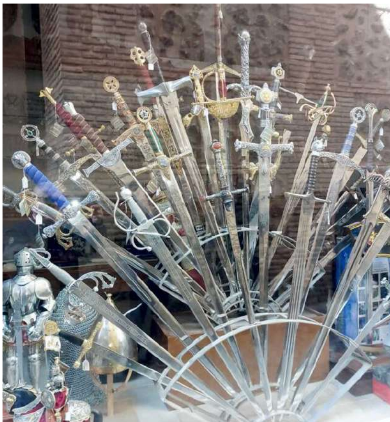
Mačevi u izlogu jedne radnje u Toledu (Španija)

Zahvaljujući ljubaznosti i poverenju Braće povereno mi je mesto u Starešinstvu naše Poštovane Lože na čemu sam im beskrajno zahvalan. I naravno, bilo je potpuno očigledno da se moram koncentrisati na poverenu mi ulogu, a šta bi bilo efikasnije nego sam Rad na tu temu. Jedna od prvih stvari na koju sam naišao u svojim istraživanjima na ovu temu je da se u francuskoj terminologiji Mačonoša naziva Ekspert, što mi je samo probudilo interesovanje jer sama ta reč, od latinske reči Expetrus znači stručnjak, znalac, veštak u nečemu, a naročito - onaj koji vrši veštačenje nečega. U "Masonskom rečniku" Danijela Ligua kao Mačonoša je označen brat koji stoji ispred vrata Lože i ima zadatak da proverava ispravnost braće koja dolaze u Ložu, što sa današnjom ulogom Mačonoše nema previše sličnosti. Ali, zato uloga Eksperta je nešto potpuno drugo, i predstavlja upravo ono što se u našoj Obedijenciji poklapa sa ulogom Mačonoše. Pretpostavljam da je većina onoga što ću navesti u sledećim redovima poznato Braći, ali mislim da može jako biti interesantno podsetiti se na to.